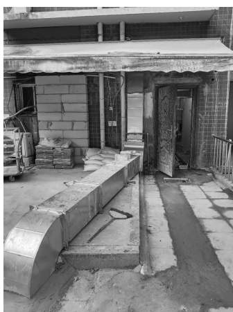
油烟管道排入下水道

上述案例的成功处置是新吴区城管部门深化“城管进社区”工作的一个缩影。自开展“城管进社区”工作以来,新吴区城管部门切实将城市管理触角延伸到社区内部,实现城市管理由被动执法向主动服务、由“粗放”管理向精细管理的深层次转变,切实解决“看得见的管不了”“管得了的看不见”问题。目前全区各街