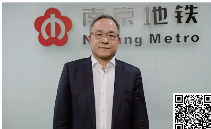
全国人大代表,南京地铁集团有限公司党委书记、董事长余才高

诸多建议中,加强全国城市轨道交通立法,余才高一提就是5年。余才高说:“相关部门每次都积极和我沟通交流,告诉我鉴于我国城市轨道交通行业刚刚起步,还有一些问题没有暴露,目前立法还不是很成熟,而是用政府规章和规范性