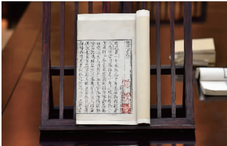
南京图书馆藏明刻本《越绝书》