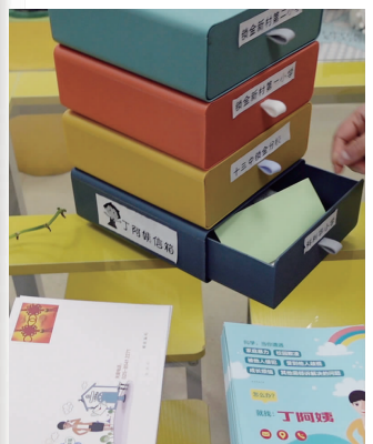
丁冬冬将收到的信按学校存放