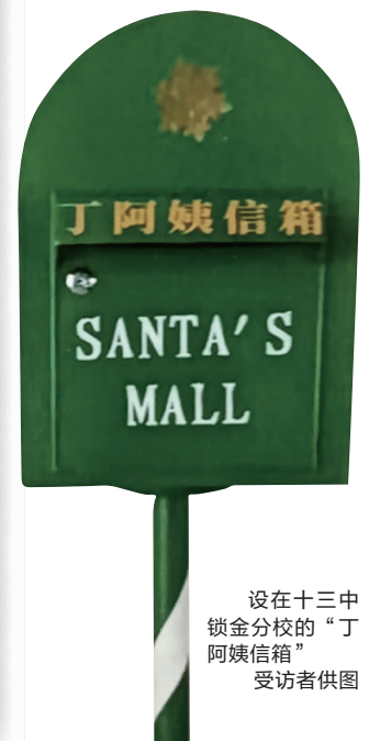
设在十三中锁金分校的“丁阿姨信箱”