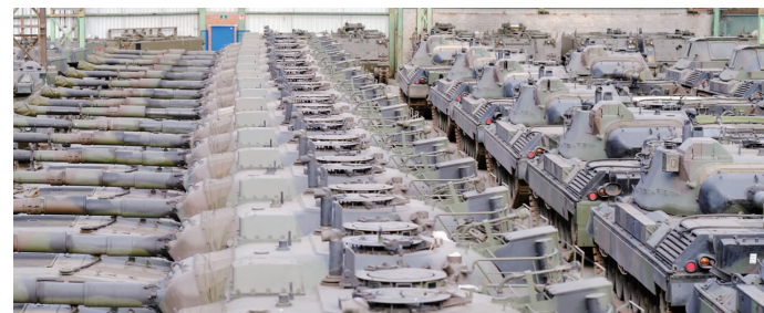
比利时一家防务公司军火库里的“豹1”坦克(资料图片)

德国、荷兰与丹麦国防部7日在一份联合声明中说,将投入资金,修整军工企业库存中至少100辆“豹1”式坦克,并在数月内交付乌克兰。