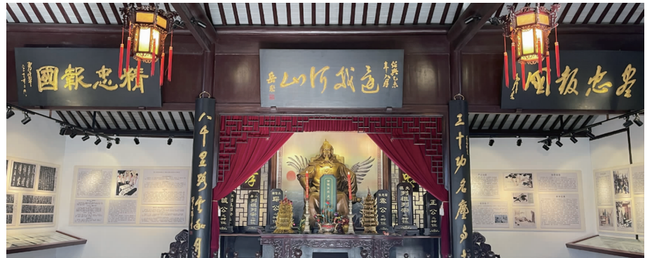
常州横山桥的蓉湖岳飞纪念馆

岳飞驻扎在宜兴时,以张家祠堂作为大本营,设岳飞行馆,在此生活、练兵。在此期间,地方乡绅纷纷资助岳飞招兵买马,岳家军迅速壮大。岳飞行馆所一度毁于兵火,清代光绪年间重建,1996年11月被列为宜兴市文物保护单位,行馆内还有武穆印迹、岳飞诗文、岳飞塑像、张完塑像等。