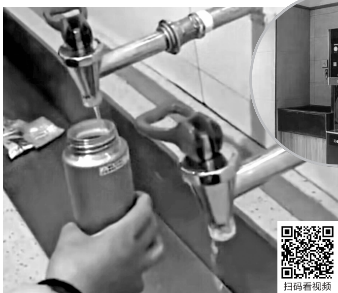
大图:免费开水流量小 视频截图;小图:收费的净水设备 涉事公司供图

近日,有网友反映,在江苏高速成子湖服务区,免费提供的开水流量很小,旁边需要付费购买的开水流量却很大,并质疑是诱导旅客使用收费的开水。对此,涉事服务区回应称,免费开水流量小是因使用量较大导致,并非有意为之。收费净水机是外包公司投放的,盈亏与服务区无关。据了解,收费直饮水设备是常州一家公司投放的。2月1日,涉事公司向现代快报记者表示,收费开水为净化水,收益主要用于回收成本以及水、电、设备维护等各项开支。