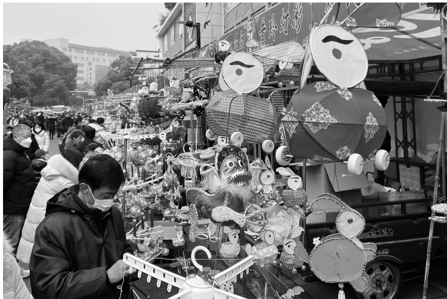
春节期间,夫子庙花灯市场上,造型各异的兔子花灯“闹新春”