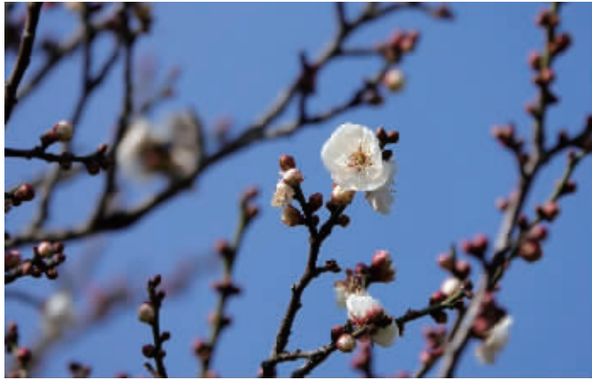
去明孝陵景区“探梅”正当时(资料图片)