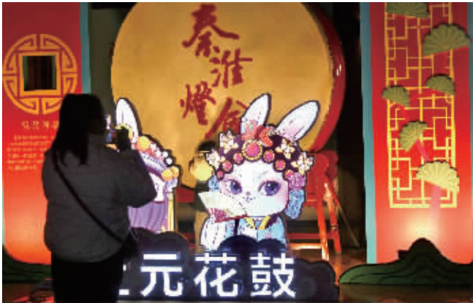
去秦淮灯会体验金陵烟火气(资料图片)