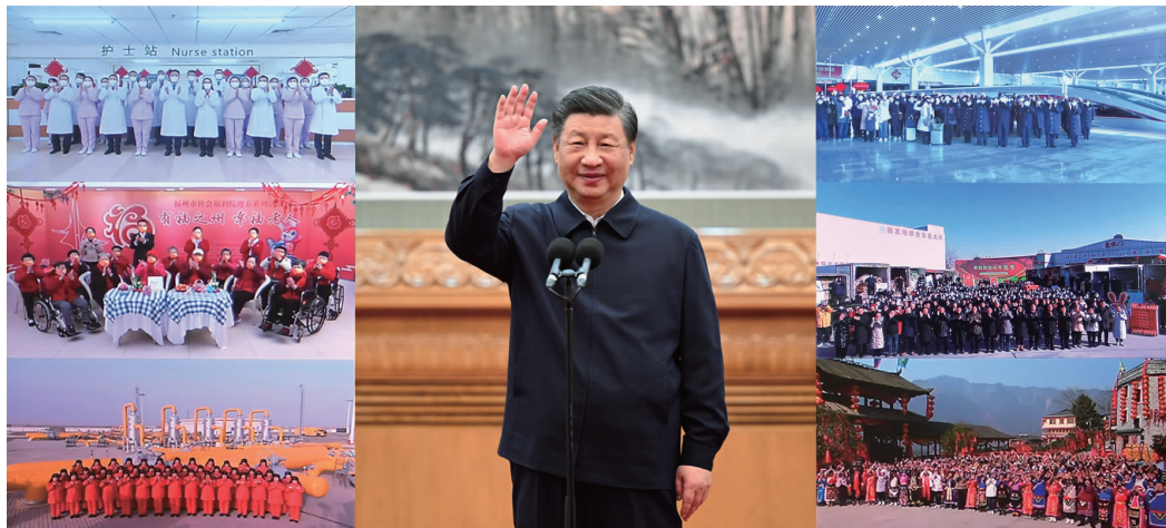
1月18日,中共中央总书记、国家主席、中央军委主席习近平在北京通过视频连线看望慰问基层干部群众,向全国各族人民致以新春的美好祝福(拼版照片)

据新华社北京1月18日电 中华民族传统节日春节即将到来之际,中共中央总书记、国家主席、中央军委主席习近平通过视频连线看望慰问基层干部群众,向全国各族人民致以新春的美好祝福,祝各族人民身体健康、阖家幸福、事业进步、兔年吉祥!祝愿伟大祖国繁荣昌盛、国泰民安!