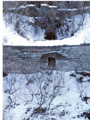
北京箭扣长城一处暗门