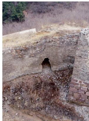
“暗门家族”中最为隐秘的突门遗存