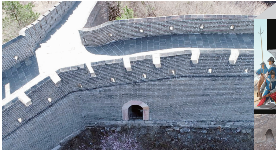
天津黄崖关长城一处暗门