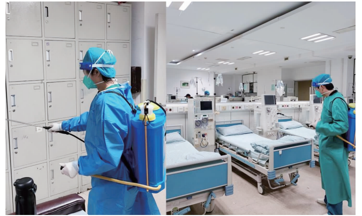
医院血液净化中心正在做室内消杀工作

快报讯(通讯员 潘梦娇 张翼 达 程守勤 记者 安莹)近期,随着新冠病毒阳性感染者持续增多,血液透析患者作为特殊高危人群,面临严峻挑战。东南大学附属中大医院血液净化中心微信护患沟通群里,传来许多透析患者发烧变阳的消息。“无论如何,要保证阳性肾友能够正常血透!”该院血液净化中心医护人员迅速制定方案,为肾友开辟阳性透析区。