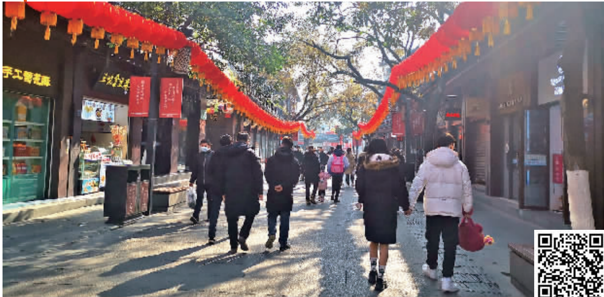
夫子庙景区张灯结彩 扫码看视频

2022年的最后一天,你在哪度过? 2022年12月31日是元旦假期的第一天,阳光煦暖,不少“阳康”市民选择走走逛逛,亲近自然。现代快报记者走访了玄武湖公园、明孝陵、夫子庙、瞻园、大报恩寺遗址景区等南京各大热门景区,发现不再查验核酸、健康码后,市民游客进入景区更加方便,但每个人都自觉地佩戴口罩。各个景区里的人并不多,游览舒适度高,迎接新年的喜庆氛围已经拉满。