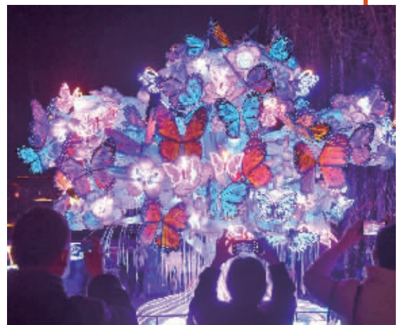
老门东景区