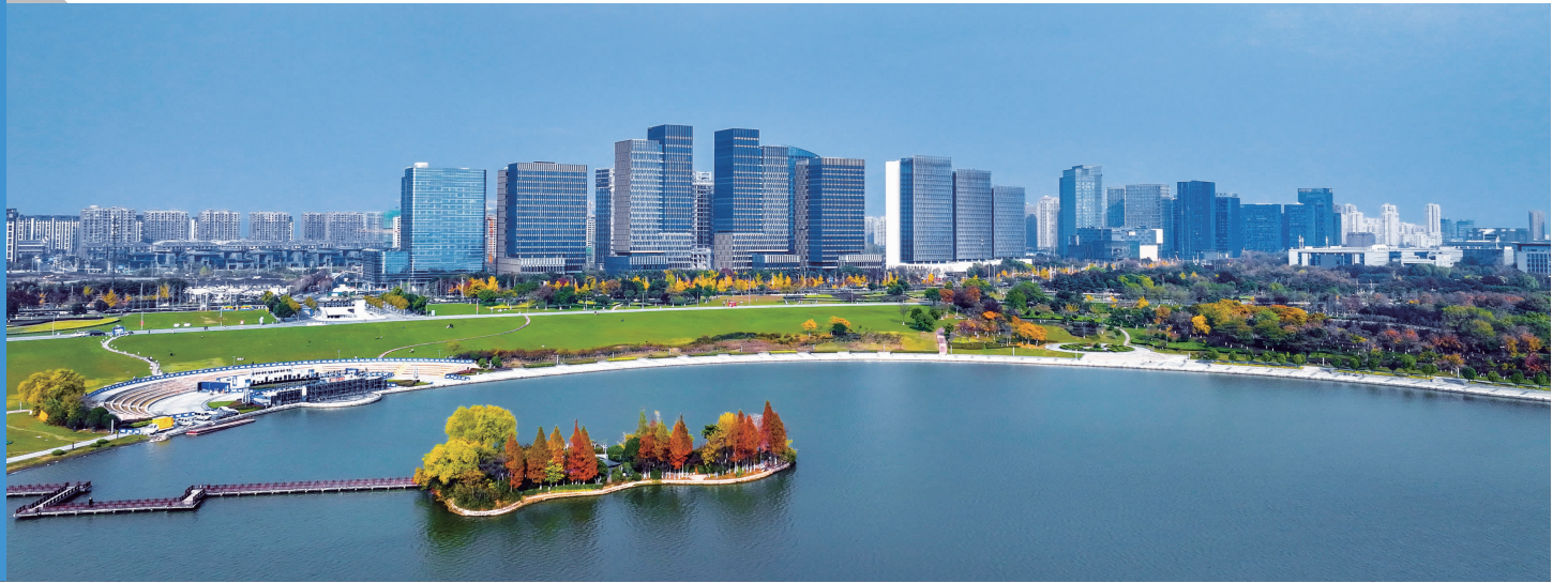
淮海经济区金融服务中心