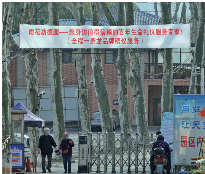
雨花功德园推出百年生命礼仪服务

雨花功德园24小时服务专线:52431893或18951664444,可咨询小型生态墓和殡葬一条龙服务的情况。