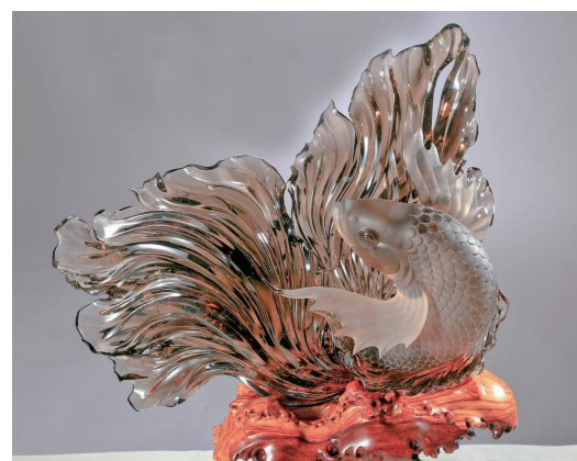
来自连云港的水晶文化IP作品《海阔凭鱼跃》