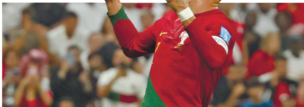
C罗在与瑞士的比赛中替补上场