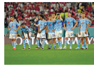
卡塔尔时间12月6日，西班牙队球员在点球大战中