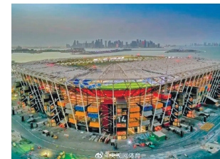
974球场外观

在巴西与韩国的1/8决赛结束后，974球场结束了本届世界杯的所有比赛，目前已开始拆除工作。