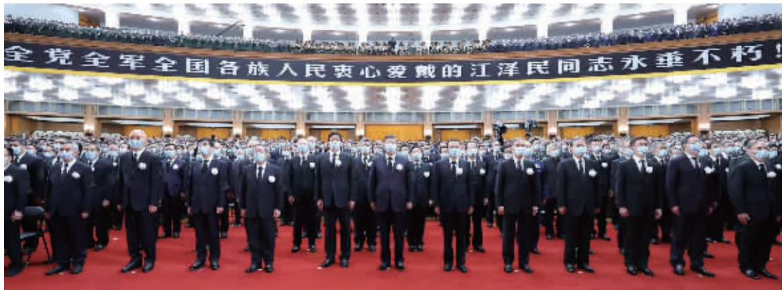
12月6日,中共中央、全国人大常委会、国务院、全国政协、中央军委在北京人民大会堂隆重举行江泽民同志追悼大会。习近平、李克强、栗战书、汪洋、李强、赵乐际、王沪宁、韩正、蔡奇、丁薛祥、李希、王岐山等参加大会