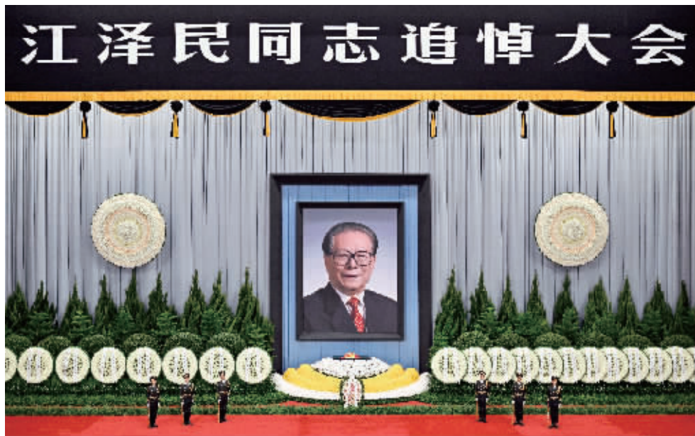
江泽民同志的骨灰盒安放在遗像前的鲜花翠柏丛中,骨灰盒上覆盖着鲜红的中国共产党党旗