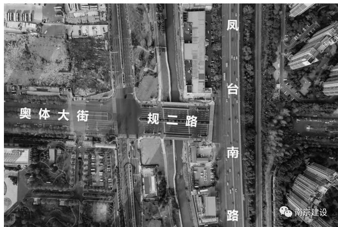
规二路西延一期工程

快报讯(通讯员 宁建轩 记者 杨晓冬)跨区“断头路”建设是今年南京重点民生实事项目。12月6日,现代快报记者从南京市城乡建设委员会获悉,继岱山东路北延、338省道雨花经开区段建成通车后,规二路西延(凤台南路至西城路段)也即将开放交通,为市民群众提供更便捷的出行体验。