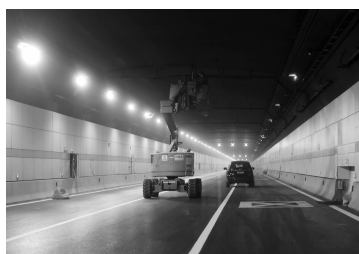
隧道正在进行内装施工