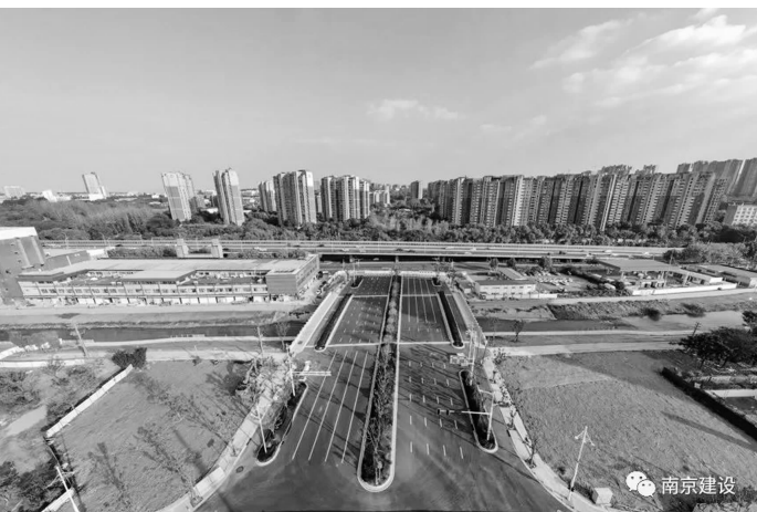
规二路西延(凤台南路至西城路段)

此外,备受关注的东麒路北延也迎来重要节点。东麒路北延工程是连接栖霞、江宁的一条重要通道,项目沿老东麒路向北上跨沪宁高速公路,终点接仙林大学城汇通路南延,道路全长约2.5公里。为有效改善沿线居民出行条件,东麒路