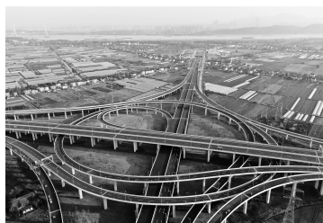
八卦洲西枢纽与隧道相连