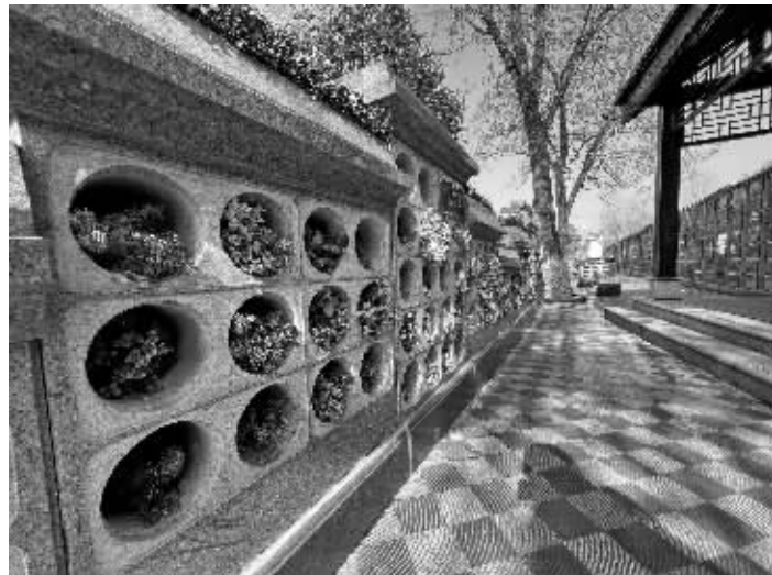
雨花功德园多措并举,让市民越来越认同节地生态葬