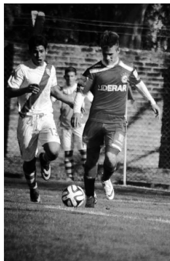
2014年的亚历克西斯·麦卡利斯特(中)在比赛中