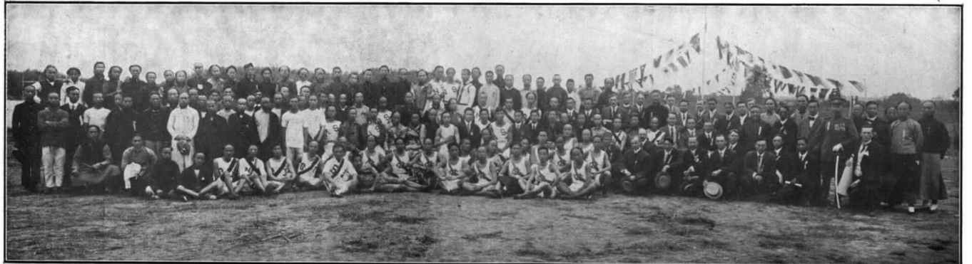
1910年，首届全国运动会上，运动员和工作人员合影