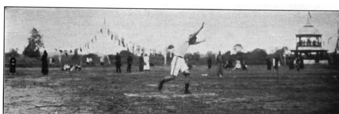
跑马场的历史照片