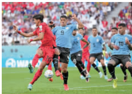
黄义助(左一)防守苏亚雷斯(左二)