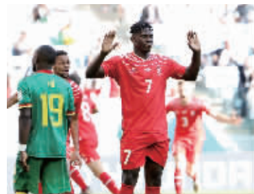
恩博洛(右)进球后不庆祝

北京时间11月24日,世界杯G组首轮比赛,瑞士迎战喀麦隆。比赛第48分钟,恩博洛接到沙奇里妙传首开纪录,帮助瑞士队以1:0击败喀麦隆迎来开门红。但在进球之后,恩博洛并没有庆祝,甚至面露歉意,很多人表示不解,原来,恩博洛1997年2月14日出生在喀麦隆雅温得市,是瑞士的归化球员。