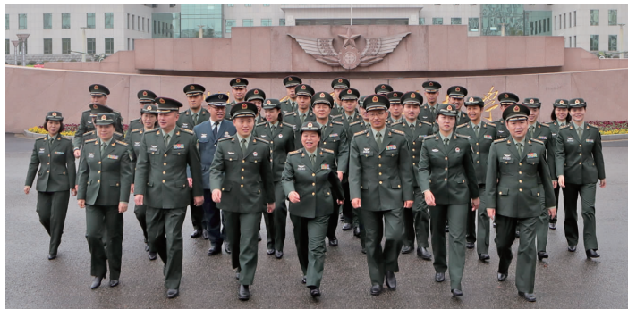
“星火”理论宣讲服务政治教员群体