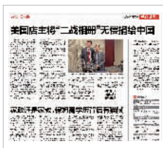
现代快报相关报道

随后,记者又致电了中国驻芝加哥总领事馆,询问相册目前的状态。领事馆文化处的一名工作人员证实了埃文所说情况属实,相册已