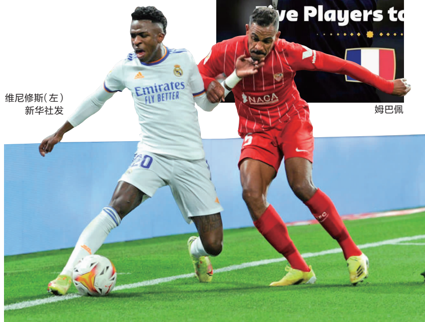
维尼修斯(左)