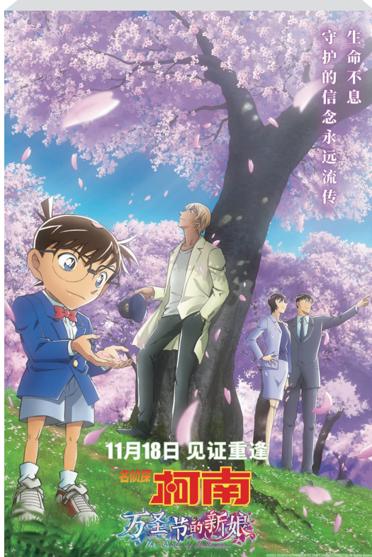
《名侦探柯南：万圣节的新娘》海报