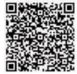
江苏文脉视频号 看直播

南京师范大学文学院院长，中国古代文学专业教授、博士生导师，中国词学研究会常务理事，江苏省古代文学学会副会长，江苏省中华诗学研究会副会长，多年从事唐宋诗歌以及地域文化与文学研究。