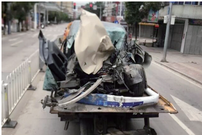
车主家属网上发布事故现场图