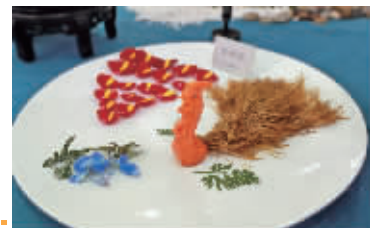
山花蒂是 以全素食材做成 的宴席,每道菜以 词牌名为名,并且 造型仿真