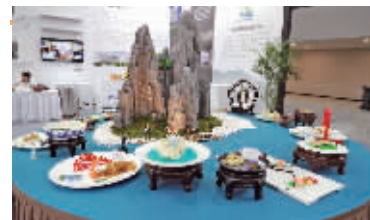
淮扬菜名 宴山花蒂