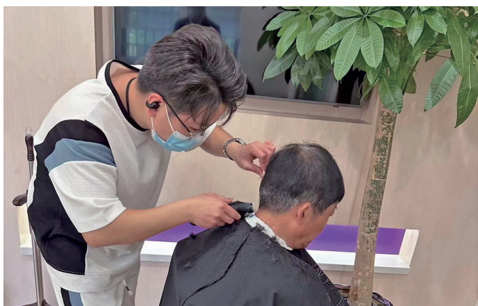
光大银行无锡分行锡山支行员工为周边社区老年客户理发

当天一大早，光大银行无锡分行锡山支行热闹非凡，受邀前来的客户早早来到支行，排队坐好等候理发。一张板凳，一套工具，理发师在充分做好消毒防护的准备下，一边熟练地为老人围上围布，一边询问需要什么发型，让老人在家门口享受到优质服务。理发过程中，光大银行理财经理不时与老人亲切交谈，关心他们的身体状况，倾听他们的真实需求，宣讲存款保险制度、反假币知识、防范金融诈骗知识等，并温馨提示老年居民提高个人金融安