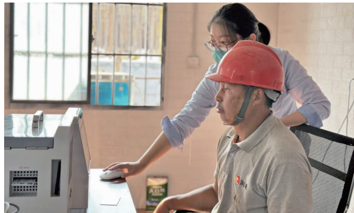
邮储银行无锡市分行安镇支行主动提供上门一站式全套服务

邮储银行无锡市分行考虑到江苏浦盛建设工程有限公司地处东北塘，地段偏远周边银行少、务工人员上班时间分散等特点，同时我行作为农民工工资保障代发行，第一时间联合无锡市人力资源和社会保障综合服务中心，携外拓便携式发卡设备共同为工地提供“社保—金融—交通”一体化的一揽子综合服务。较普通工资卡而言，这张邮储银行第三代社会保障卡能