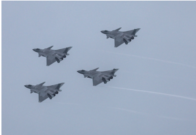
11月8日,歼-20四机编队在第十四届中国航展上进行飞行表演

11月8日,第十四届中国航展在广东珠海开幕,多型战机共舞蓝天,我国新一代运载火箭家族的模型也集体亮相,其中包括备受瞩目的载人登月“专车”——新一代载人运载火箭。第十四届中国航展8日至13日举办。