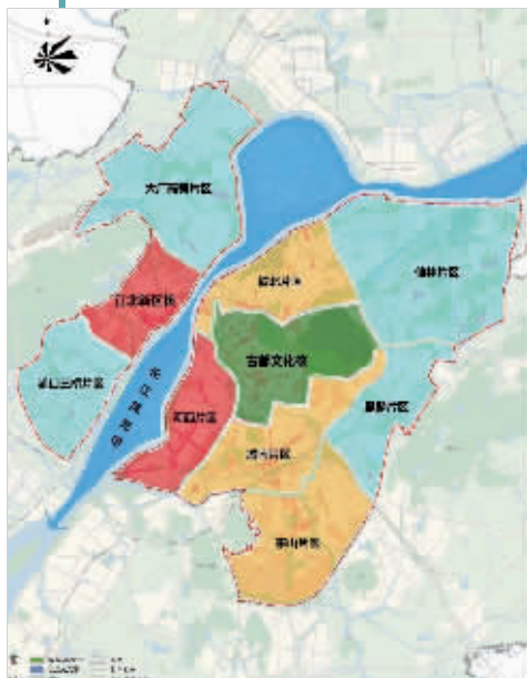
中心城区城市空间结构图