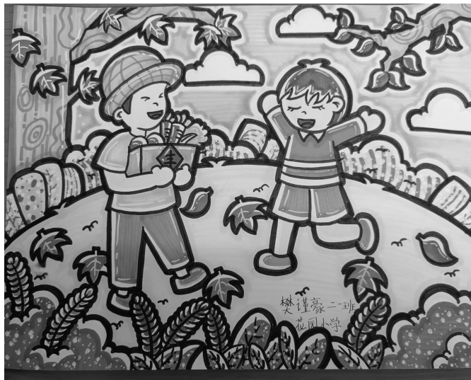
二(1)班 樊谨豪 指导老师:张玉澄