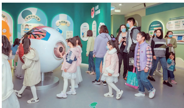
参观科普馆

近日,温医大眼视光眼健康科普馆扬州分馆正式开馆。据悉,这是扬州市第一家青少年眼健康科普馆。