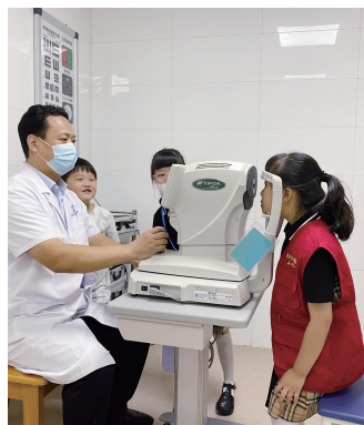
为小记者做检查

……”活动中,王医师从学习、饮食、日常用眼等方面,结合实例形象生动地讲解眼睛的知识,并且指出生活中有可能造成近视的隐患,让小记者们明白保护眼睛的重要性。随后,小记者们在医生的指导下参观了眼科中心,沉浸式了解医学验光检查设备及流程。看着这么多的设备,孩