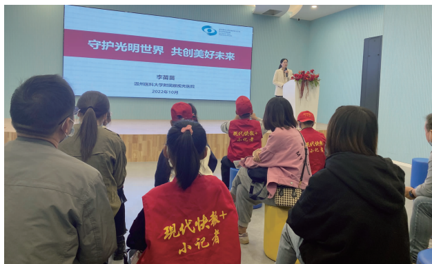
眼健康科普课堂

眼睛是心灵的窗户,青少年时期更是养成良好用眼习惯的黄金时期。近日,现代快报小记者来到高邮眼科视光中心,沉浸式体验学习眼健康知识。