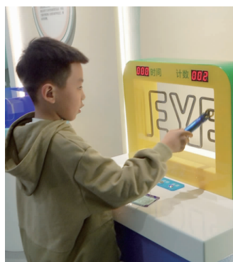
互动区体验

开馆当天,小记者也来到科普馆参观学习眼健康知识,了解近视危害、正确用眼方式、方法等,将爱眼护眼知识“入心入脑”。在爱眼演讲区,小记者和家长们学习了一堂眼健康科普