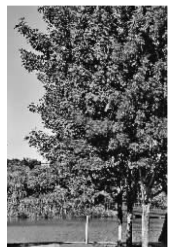
青枫公园内色叶之美缤纷醉龙城

一个时节,一树风景。随着温度逐渐降低,11月至12月,青枫公园内的红橡树、金钱松、三角枫、紫薇、柳叶栎等色叶树也将变得多姿多彩。梧桐、美国红枫中的十月光輝、银杏、紫薇、乌桕、鸡爪槭、蓝果树、黄连木等色叶树也将达到最佳观赏期。无论是落叶,还