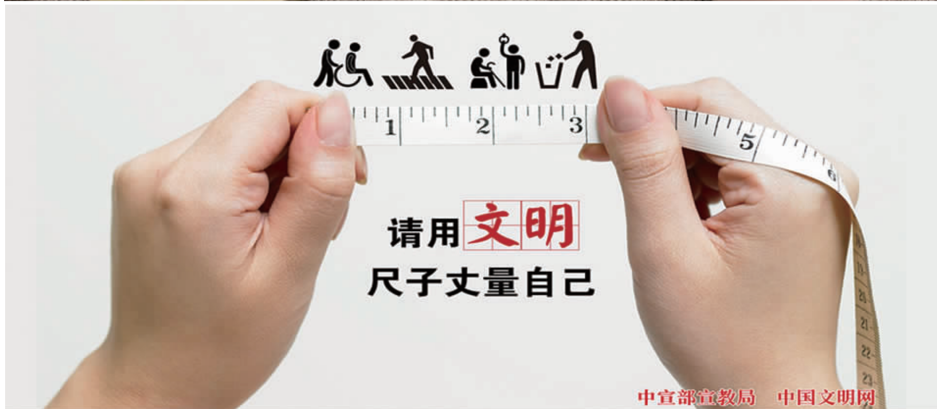
中宣部宣教局 中国文明网