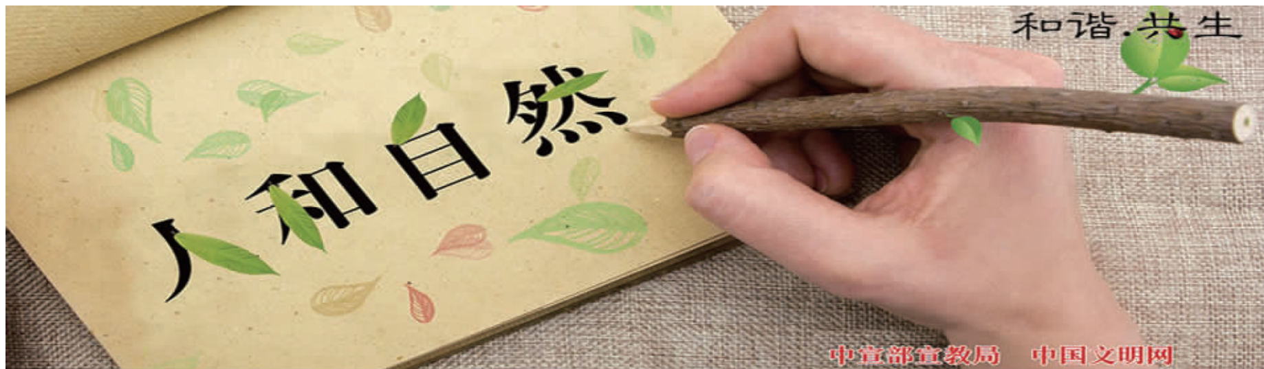
中宣部宣教局 中国文明网