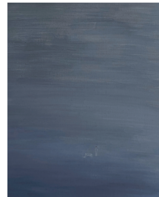
《果人 青蓝色里一僧禅》50×60cm 布面油画 2022