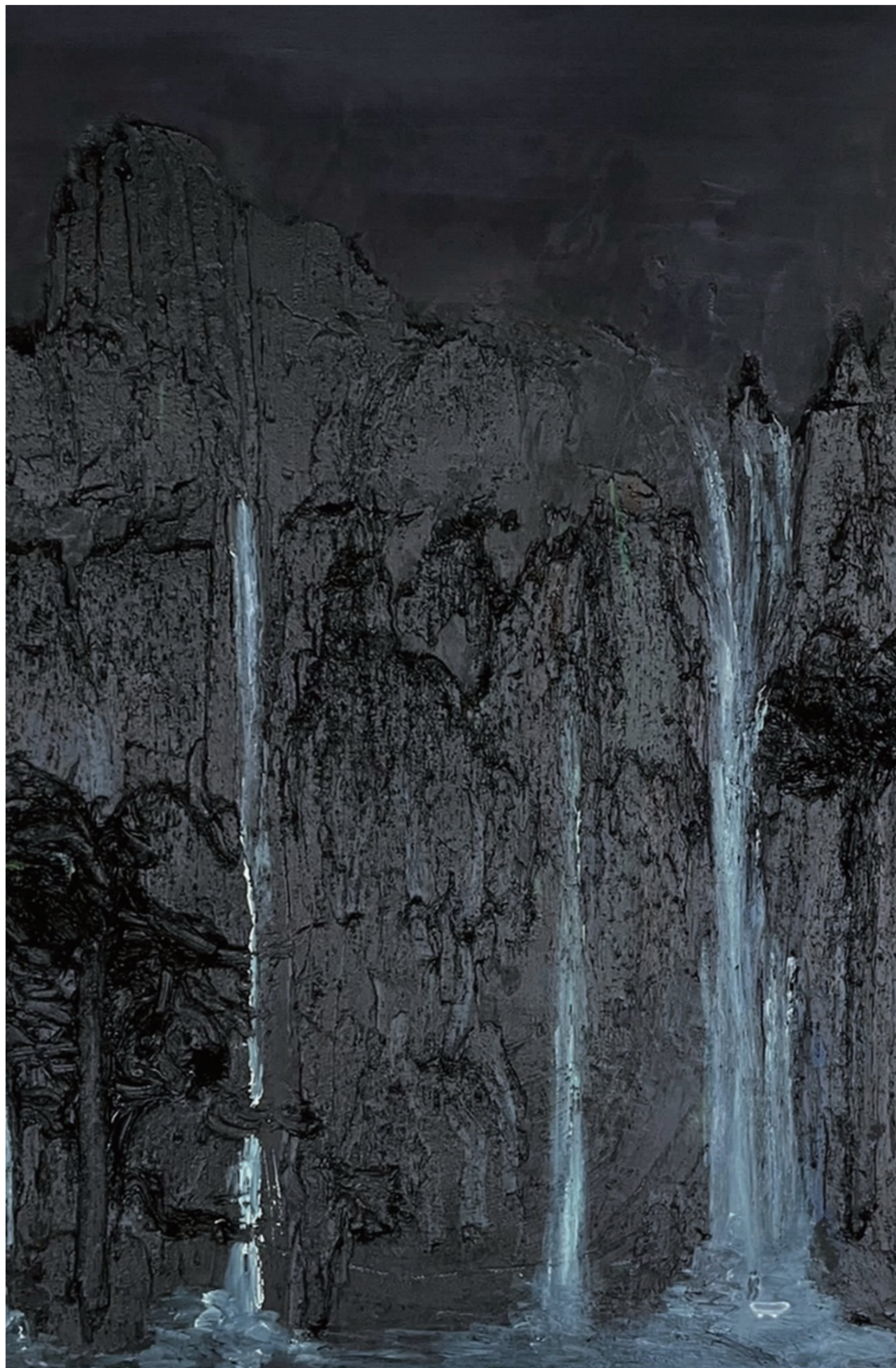
《果人 麒麟潜翼》40×50cm 布面油画 2021