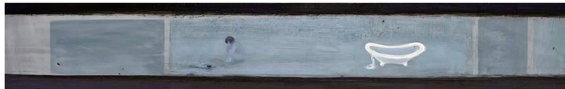
《果人 抱抱你》60×100cm 布面油画 2022