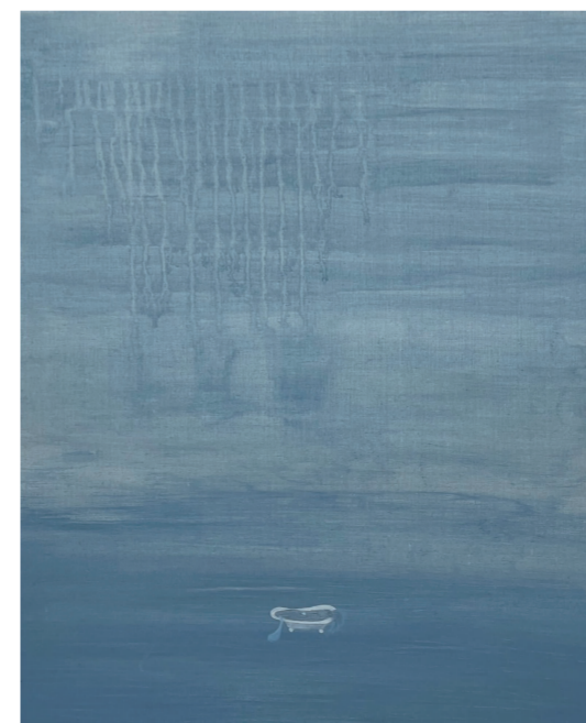
《果人 雨过天青云破处》50×60cm 布面油画 2022

对于创作,流丹始终坚信艺术没有捷径,艺术家得保持一颗初心,不受外界干扰,不设风格限制,秉着自己的本心去画,慢慢的路就清晰了,这是一个自然选择的过程。“我肯定是一路摸索,探索到最后形成一个自己的‘我’。也许我的展览多变,但我尊重自己,做真实、真诚的自己,无需多想,从心表达就好。”流丹说。