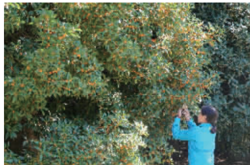
桂花美景吸引游客拍照