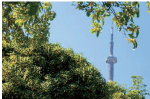
古林公园的桂花繁花满树