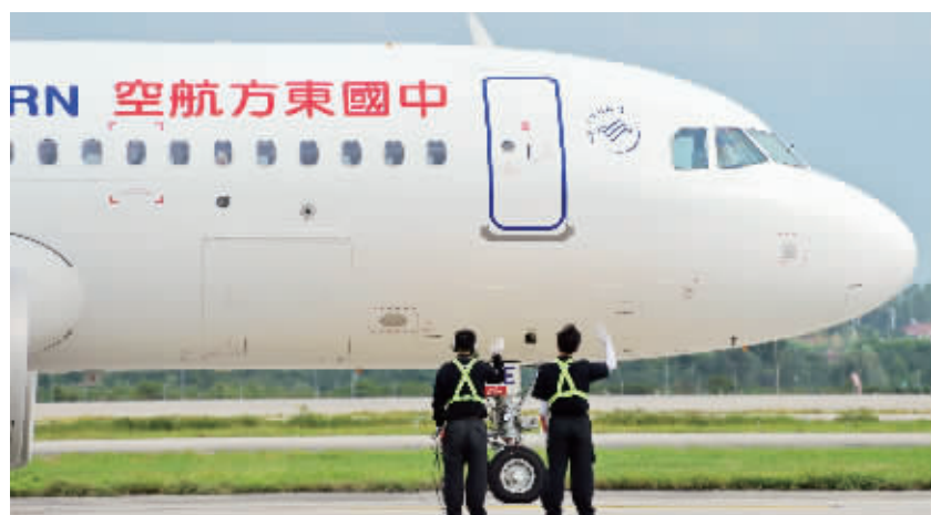
飞机起飞前,飞机维修人员会挥手告别,这是日常工作,更是一种承诺和祝福

快报讯(记者 刘伟娟)最近,一段停机坪上“飞机拜拜员”的视频火了。他们每天跟飞机挥手告别,让网友羡慕不已。这到底是个什么工种?10月13日,现代快报记者从东航江苏公司获悉,每架飞机起飞前,都会有飞机维修人员送机。跟飞机挥手告别对他们来说,不仅是日常工作,更是一种承诺和祝福。