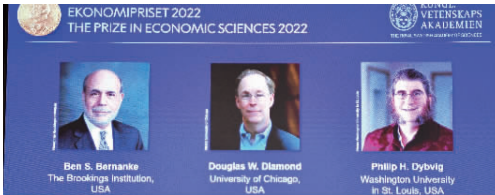
2022年诺贝尔经济学奖公布现场

瑞典皇家科学院10日在斯德哥尔摩宣布,将2022年诺贝尔经济学奖授予经济学家本·伯南克、道格拉斯·戴蒙德和菲利普·迪布维格,以表彰他们在银行与金融危机研究领域的突出贡献。