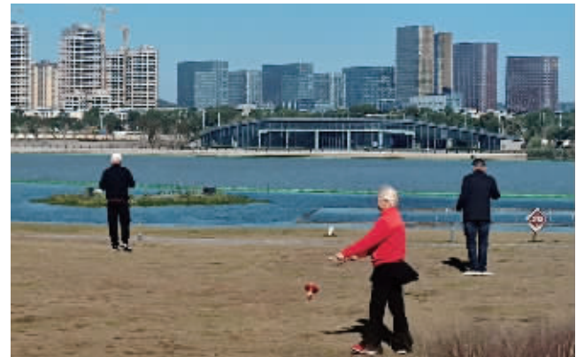
昨天，南京气温降至个位数，户外锻炼者穿上厚衣

今天 晴到多云 偏北风3到4级 6~19℃ 明天 晴到多云 偏东风4级左右 8~21℃ 后天 多云 偏东风3到4级 10~23℃