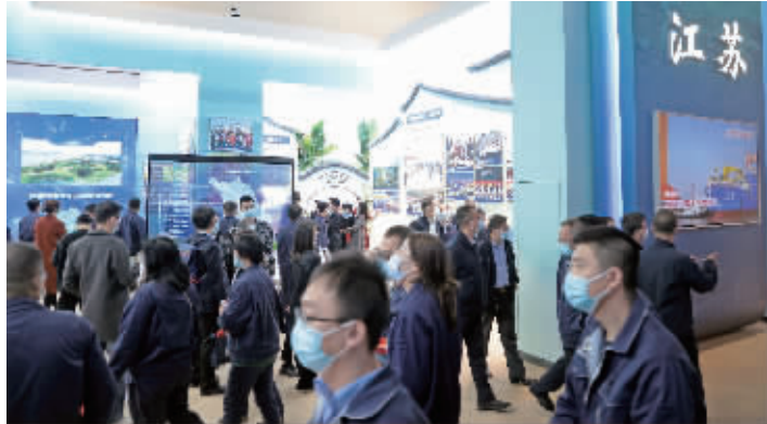
江苏展区观众络绎不绝