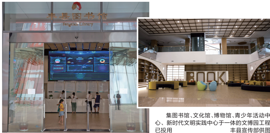
集图书馆、文化馆、博物馆、青少年活动中心、新时代文明实践中心于一体的文博园工程已投用