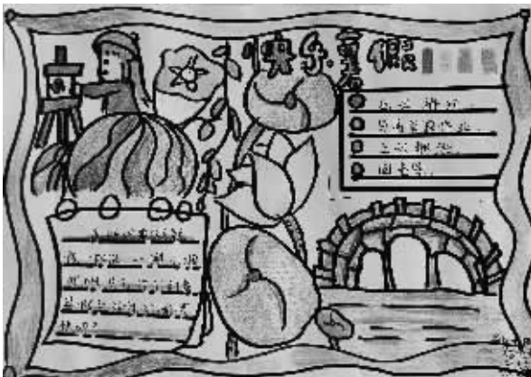
五(5)班 张玉乐 指导老师:赵虎

子,红红的辣椒,金黄的菜花,清晨还有洁白的露珠在菜叶上滚来滚去,一眼瞧去,菜园五颜六色,好看极了!