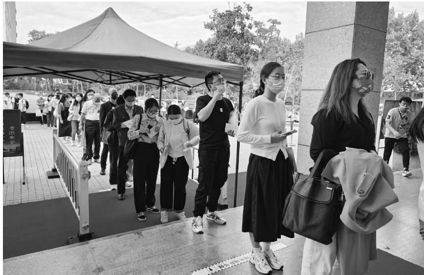
等候进场的考生