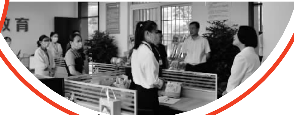
孙县长与一线教职工亲切交谈