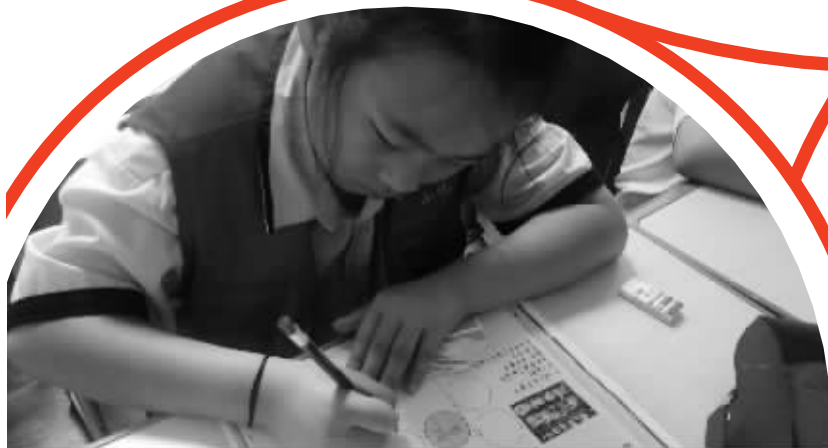
小记者思维导图练习

今岁中秋月，喜连教师节。一轮明月，两种情感，有对团圆的期盼，也有对老师的谢意。感谢每一位教师，用爱交织成月亮，为学生带来温暖和希望。本次活动不仅加深了学生对中国传统节日的了解，体验到了传统节日的乐趣，更让沛县汉兴小学这个大家庭充满了团结、和睦、快乐的氛围！ 张茜