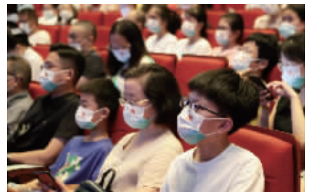
现场观众听得津津有味

中,常熟可以找到唐宋各个“浦”的旧址,立碑做标志。“这二十几个碑连起来,大家就可以看到,如果在唐朝,这里面是陆地,外面是大海。这对于常熟市民理解本地历史文化相当有意义。”