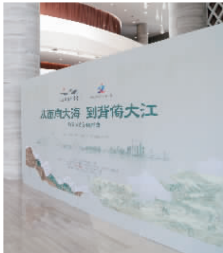
江苏文脉大讲堂第四讲走进常熟