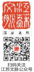
扫码关注 江苏文脉公众号