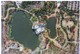
麒麟湖(左)和沧波湖

专家们认为，这次南京麒麟生态公园湖泊被命名为“麒麟湖”和“沧波湖”，是对老地名文化的一种传承。