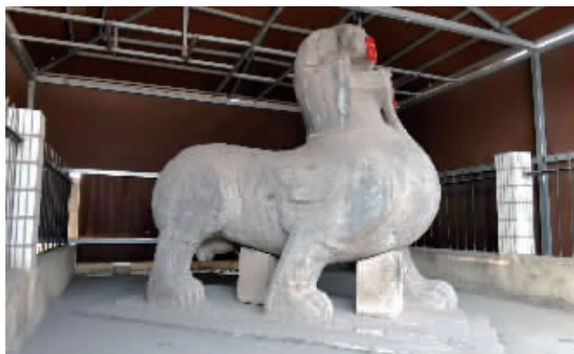
初宁陵的麒麟石刻

南朝宋开国皇帝刘裕，小字“寄奴”。“斜阳草树，寻常巷陌，人道寄奴曾住。想当年，金戈铁马，气吞万里如虎。”辛弃疾的《永遇乐·京口北固亭怀古》说的就是他。