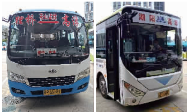
南京高淳发往狸桥、湖阳的公交车