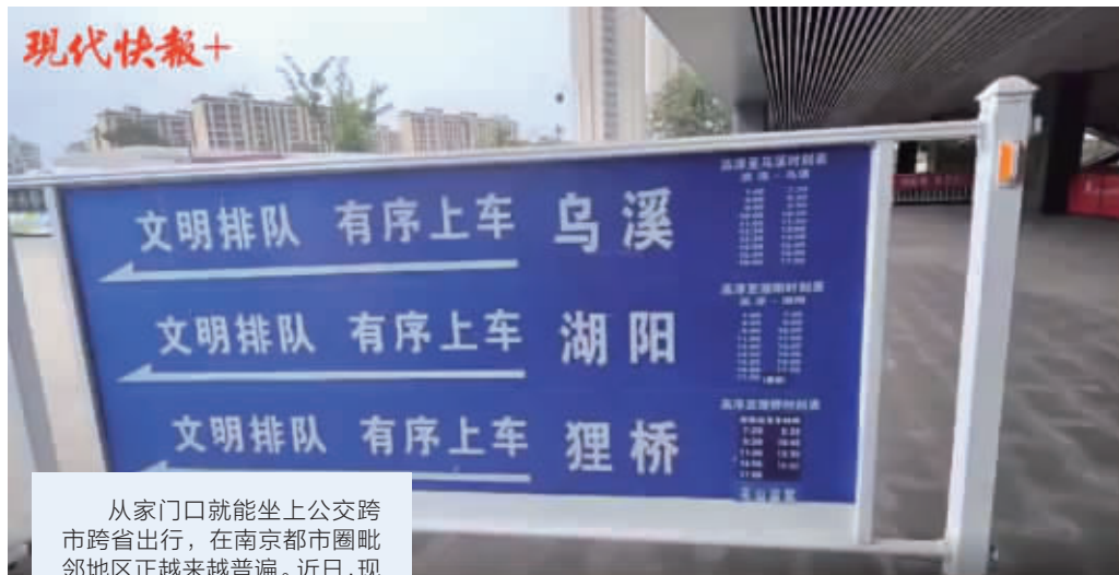
南京高淳到都市圈的公交班线(视频截图)

从家门口就能坐上公交跨市跨省出行,在南京都市圈毗邻地区正越来越普遍。近日,现代快报记者从南京市城市公共交通乘客委员会获悉,据不完全统计,当前南京与周边城市已开通约50条毗邻公交线路。自去年南京都市圈规划获批以来,“圈”内乘坐公共交通出行更是便捷不少。除了省内首条跨市轨道交通S6宁句地铁,约一年半的时间里,各城市间共开通13条毗邻公交线路,且以毗邻城市主动对接南京居多。