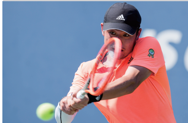
吴易昺是公开赛年代首位赢得大满贯单打正赛胜利的中国大陆男球员