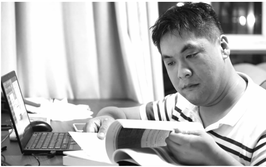
万岭时刻保持学习的习惯